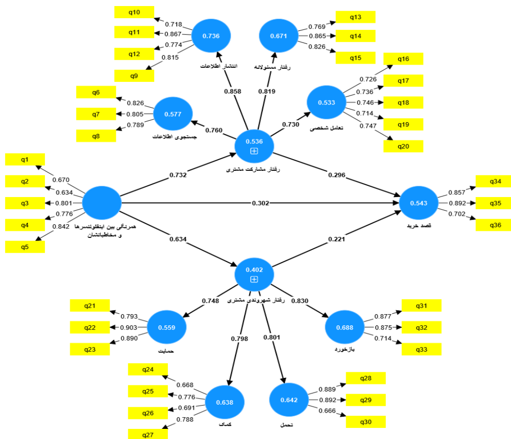
شکل ۲: خروجی مدل ضرایب مسیر