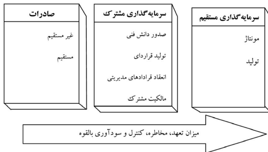
شکل (۱) خط‌مشی‌های ورود به بازار خارجی

دیگران، ۲۰۰۷؛ گریسرود و بنیتو، ۲۰۰۵؛ آسموسن و دیگران، ۲۰۰۹؛ اندرسن و بویک، ۲۰۰۲). تصمیمات اولیه در مورد نحوه ورود به یک بازار، تصمیمات استراتژیک تلقی می‌شود. این تصمیمات با عنایت به جو کشور هدف و توانایی‌های سازمان و موقعیت رقابتی صنعت به گونه‌ای انتخاب می‌شود که بتواند موفقیت رقابتی شرکت را تقویت کند (بابایی، ۱۳۸۲).